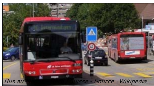
Bus au ... Suisse

11/12/2008 : Des bus qui roulent au biogaz issu des déchets (Source : ARER) LIEN