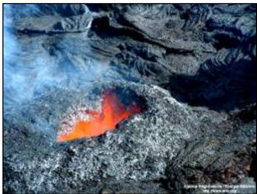
Piton de la Fournaise - La Réunion

17/12/2008 : L'électricité géothermique prête à décoller dans la Vallée du Rift en 2009 (Source : Malango) LIEN