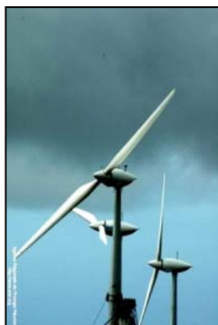
Eoliennes - La Réunion

17/12/2008 : Energie éolienne : les tarifs d'achat publiés au JO (Source : Enviro2B) LIEN