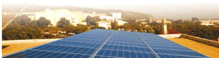
Photographies - Tous crédits : ARER

Organisme de formation agréé sous le n°98 97 029769 7